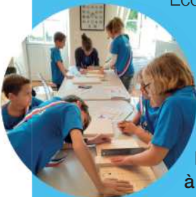
La fabrication des gîtes à chauves souris

Au début du mois d'octobre, grâce à l'association Eco-acteurs, nous avons fabriqué des gîtes à chauves souris (nous avons appris qu'une seule chauve souris peut manger 200 moustiques en une nuit)