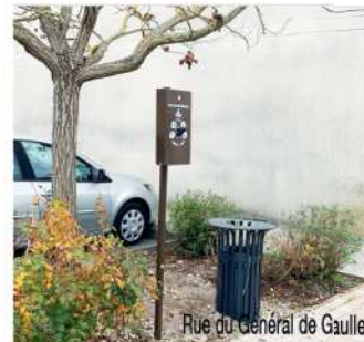
Rue du Général de Gaulle