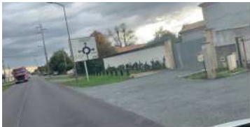
Réfections-aménagements de trottoirs Avenue de l'Europe

Certains de ces travaux tels que la dernière phase de la rue des Carrays et la création d'un plateau surélevé avenue de Canteloup seront différés au premier trimestre 2021.