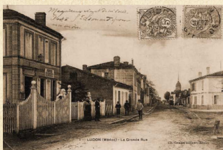
Rue Principale - Ludon-Médoc - 1905

Les cloches servaient, en outre à l'appel à l'office, à relayer les bonnes et mauvaises nouvelles de la communauté ou du royaume.