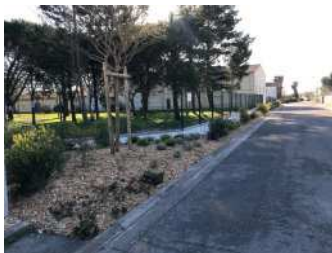
Cheminement piétons Parc Mairie

A la suite des travaux de construction de la résidence pour personnes âgées Logévie, la commune a procédé à la remise en état des enrobés sur la rue François Mitterrand et à la création d'un cheminement piéton pour faciliter l'accès à l'école maternelle en toute sécurité.