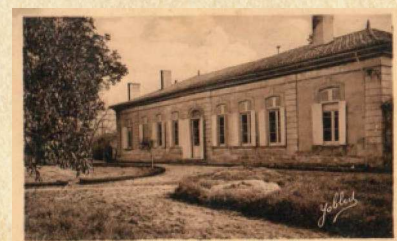
17. - LUDON Médoc (Gironde). - Château Roudon

La grande et la petite histoire s'entremêlent au gré des événements qui ont marqué notre village. Bonne lecture et n'oubliez pas que nous sommes demandeurs de vos informations sur le sommaire de ce numéro ou de tout autre événement qu'a connu notre commune.