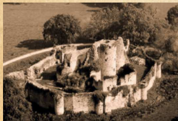
Ruines du Château de Blanquefort

La suprématie de Blanquefort prit fin en 1601 lorsque le seigneur de l'époque qui avait besoin d'argent vendit une partie de ses biens.