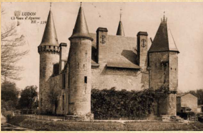
Château d'Agassac 1938

Plusieurs éléments objectifs plaident en faveur de cette solution. On trouve dans des documents anciens le nom de GASSAC comme nom de ce lieu. Il existe également une lettre du roi d'Angleterre Edouard 1er adressé à un certain Gaillard de Gassac. Enfin citons le rôle des nobles de Guyenne qui indique pour la commune de Ludon un sieur Gassac.