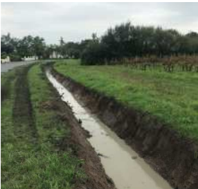
Curage des fossés

A la suite des travaux de construction de la résidence pour personnes âgées Logévie, la commune a procédé à la remise en état des enrobés sur la rue François Mitterrand et à la création d'un cheminement piéton pour faciliter l'accès à l'école maternelle en toute sécurité.