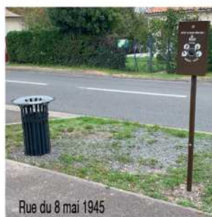
Rue du 8 mai 1945