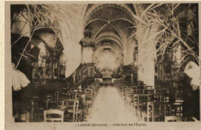
Intérieur de l'Église

Il n'en subsiste que la croix qui l'ornait. Cette porte était appelée «porte du palu» parce que les habitants qui en venaient l'utilisaient en prenant soin de laisser leurs sabots à la porte.