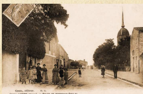
Rue Principale - Ludon-Médoc - 1910