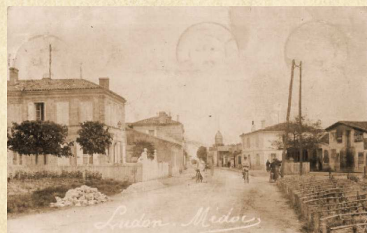
Rue Principale - Ludon-Médoc - 1905

On y enterrait encore au XVII ème siècle quand le mauvais état des routes empêchait de venir au bourg.